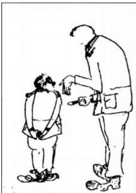
Μιχάλης και Νίκος